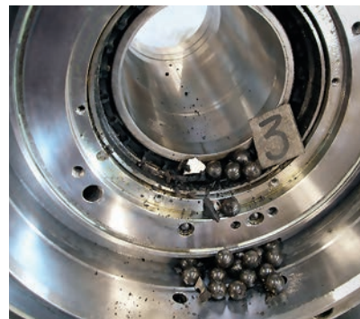
Défaillance de la broche : danger pour l'homme et la machine